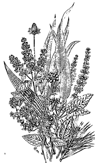
Heilpflanzen im WALA-Garten